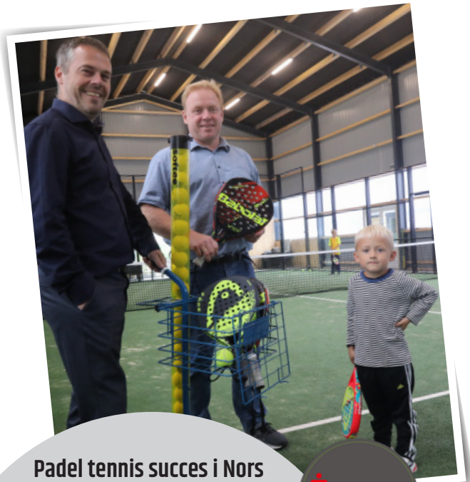
Padel tennis succes i Nors realiseret med støtte fra Sparekassen Thy og Sparinvest

...at sparekassen bakker loyalt op i medgang og modgang, er denne støtte, som de i lyset af aflysningen selvfølgelig ikke er forpligtet til at yde, i sandhed et slående eksempel på. Facebookopslag fra Jan Lyhne, Studie 7