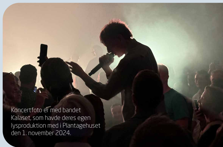
Koncertfoto er med bandet Kalaset, som havde deres egen lysproduktion med i Plantagehuset den 1. november 2024.

Det er heldigvis fortid nu. De over 20 år gamle lamper, der pyntede på scenen i Plantagehuset i Thisted, er blevet skiftet ud - sammen med loftskonstruktionen, der bærer udstyret og flere mindre forbedringer, blandt andet et sortmalet loft over scenen. Alt sammen for at give koncerterne et ekstra pift.